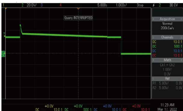
LDC302 28V 系统电压瞬变异常(过电压)